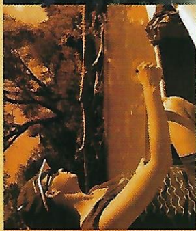
EGY FOLYÓ – NÉGY FALU

A falut a törökök 1640-ig nem foglalták el, mert a Hernád természetes védvonalat képezett a település körül, lakossága azonban többször is menekülni kényszerült, nemcsak a török időkben, hanem később, a Rákóczi-szabadságharc alatt is. Földesurai, a Bárczayak végül szlovákokkal telepítették be az elnéptelenedett falut, akik később – 1830 körül – kastélyt is építettek itt, amely a mai napig megtekinthető.